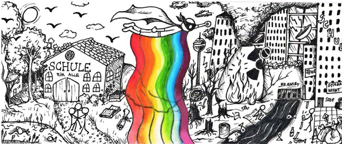
Grafik: Judith Lebski

Liebe Schülerinnen und Schüler in Rheinland-Pfalz!