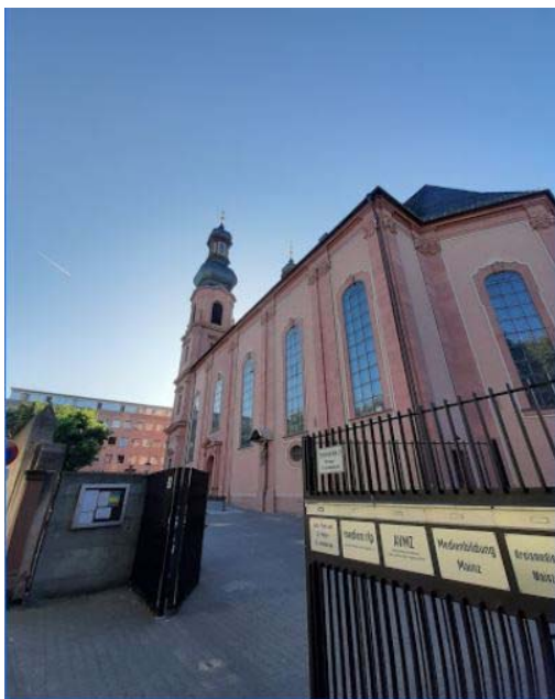
(direkt neben der Peterskirche, siehe Bild)